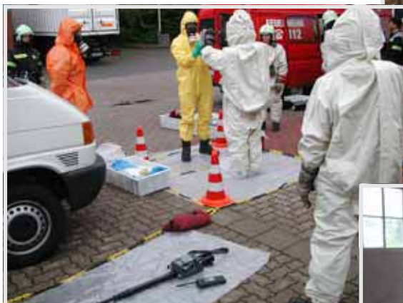
Überprüfung der Schutzausrüstung auf Kontamination