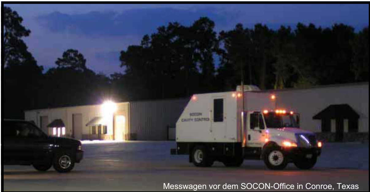
Messwagen vor dem SOCON-Office in Conroe, Texas

In 2004 ist SOCON Sonar Well Services, Inc. von DynMcDermott Petroleum Operations Company, New Orleans, der Auftrag für die Vermessung der Kavernen der strategischen Rohölreserve der USA erteilt worden. Der Auftrag erstreckt sich über eine mehrjährige Laufzeit mit Option auf Verlängerung. Neben der insgesamt erfreulichen Marktentwicklung seit dem Zusammenschluss mit Sonar & Well