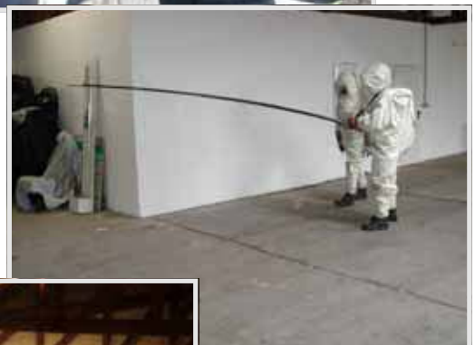
Aufsuchen des radioaktiven Strahlers mit Dosisleistungsmessgerät, ...