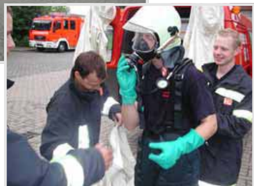
Anlegen der Schutzausrüstung