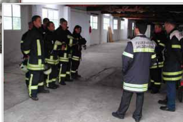
Und als Abschluss die Manöverkritik