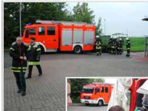
Ankunft der Berufsfeuerwehr Hildesheim auf dem SOCON-Firmengelände