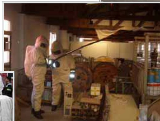
... auch unter erschwerten Bedingungen